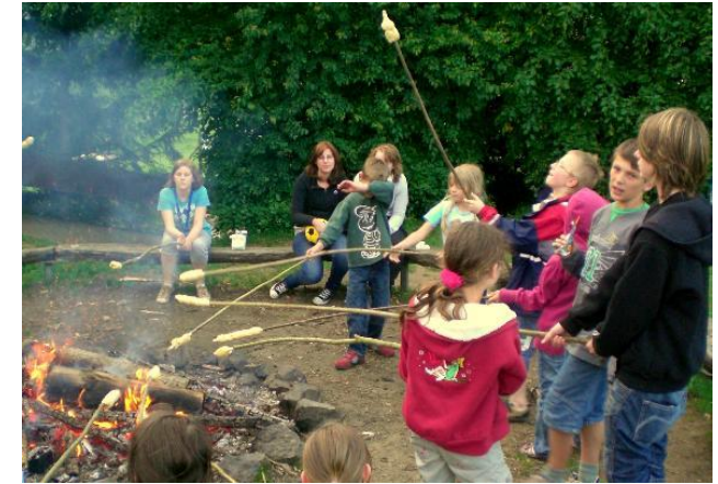
Lagerfeuer und Stockbrot auf einer Pfingstfreizeit.

Unser Pfingstabenteuer findet auf dem Hof Hagdorn statt ( www.hof-hagdorn.de ). Hier sind die Teilnehmer zusammen mit den Leitungs-kräften in (geschlechtergetrennten) Gruppenschlaf-räumen untergebracht. Zu jedem Trakt gehört je ein Dusch- und Toilettenraum;