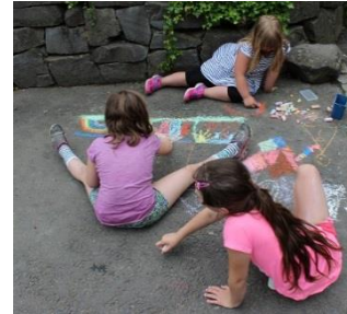
Malen auf dem Hof.

Es erwarten euch u.a. ein Weihnachtsfest, ein Silvesterfeuerwerk, eine bunte Ostereiersuche, ein herbstlich buntes Drachensteigen, ein St. Martins-Umzug sowie natürlich das schon traditionelle Lagerfeuer mit Stockbrot, Marshmallows und Co.