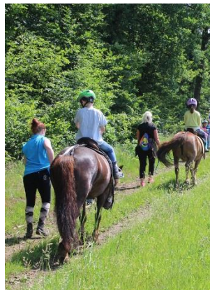
Beim Reitausflug.

Wer mag, kann auch 2018 wieder auf Ponys und Pferden (geführt) reiten, natürlich in Begleitung der Gruppenleiter.