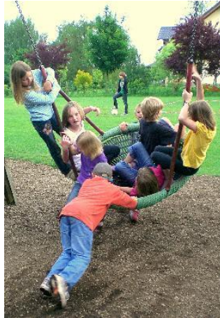
Auf dem Spielplatz.

Jeder Teilnehmer kann zwischen den vielfältigen Angeboten wählen, wird rundumbetreut, -beschäftigt und auch -verpflegt!