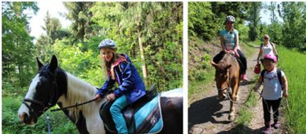
Yippee!! Reiten macht Spaß!!