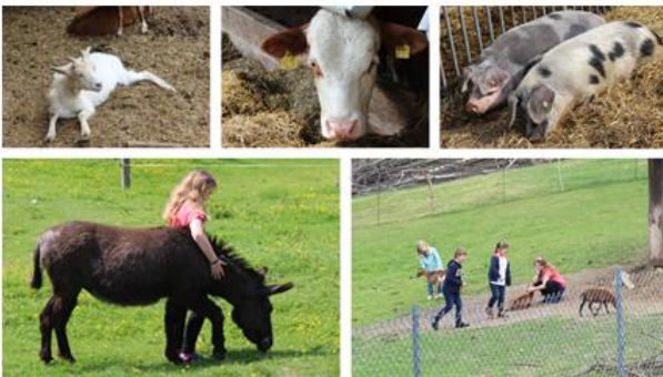
Glückliche Tiere auf dem Bioland Hof Hagdorn: Kühe, Bentheimer Landschweine, Esel und Ziegen