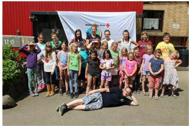
Gruppenfoto zum Abschluss der Freizeit

Ist ein Bauernhof in Rheinland - Pfalz, auf dem das JRK Leverkusen seit Jahren Pfingstfreizeiten veranstaltet. Teilnehmen können Kinder/ Jugendliche ab 6 Jahren. Eine JRK-Mitgliedschaft ist nicht erforderlich, allerdings erhalten Mitglieder Rabatt.