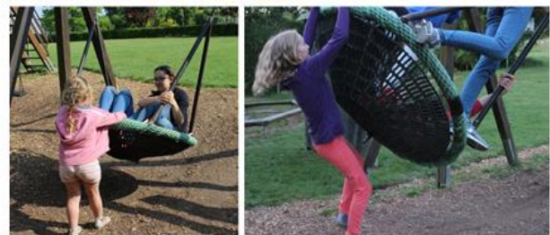
Spielen und Toben auf dem Hof Hagdorn