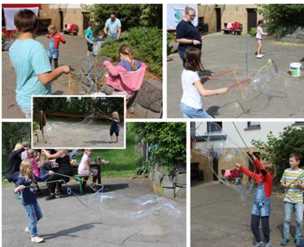
Seifenblasen-Spiele bei sommerlichem Wetter